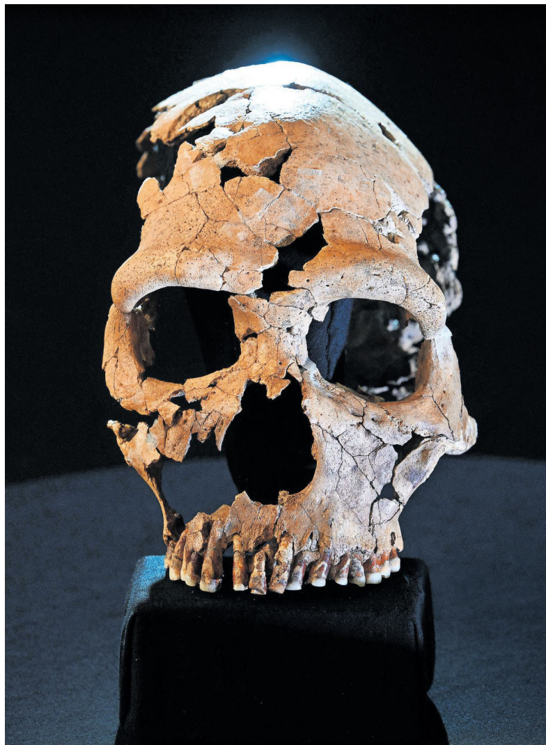
Vor 40.000 Jahren starben die Neandertaler aus. Davor pflanzten sie sich mit modernen und Denisova-Menschen fort (Bild: 75.000 Jahre alter Schädel einer Neandertalerin).